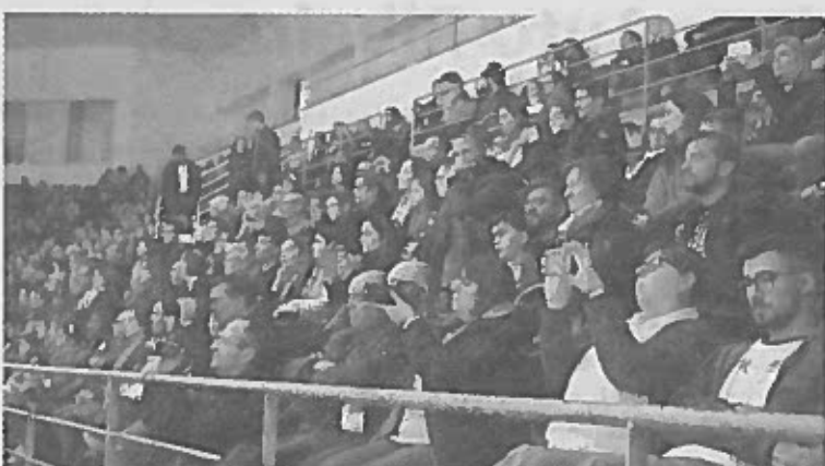
As bancadas encheram-se de pais que fizeram questão de registar o momento