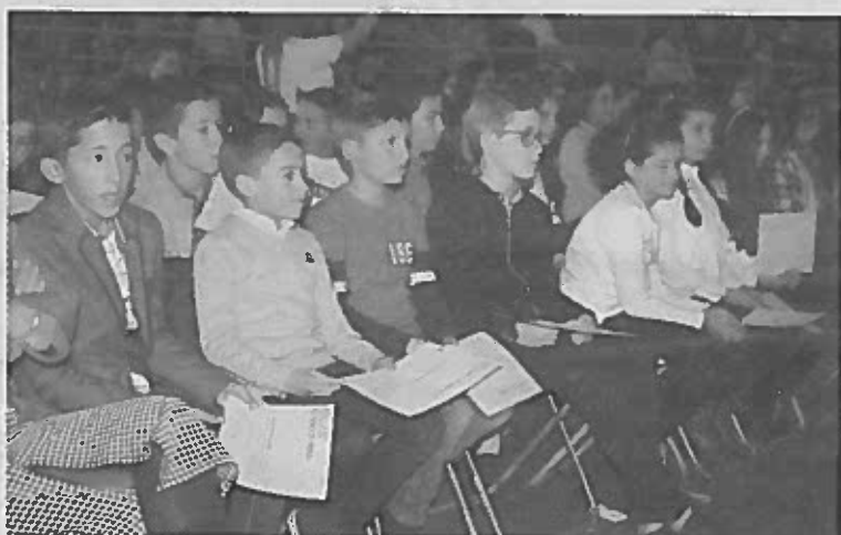
Alunos mostraram sorrisos rasgados a receber os diplomas