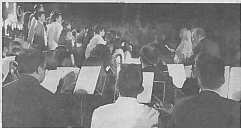
A Associação Cultural e Musical de Avintes também participou na cerimónia